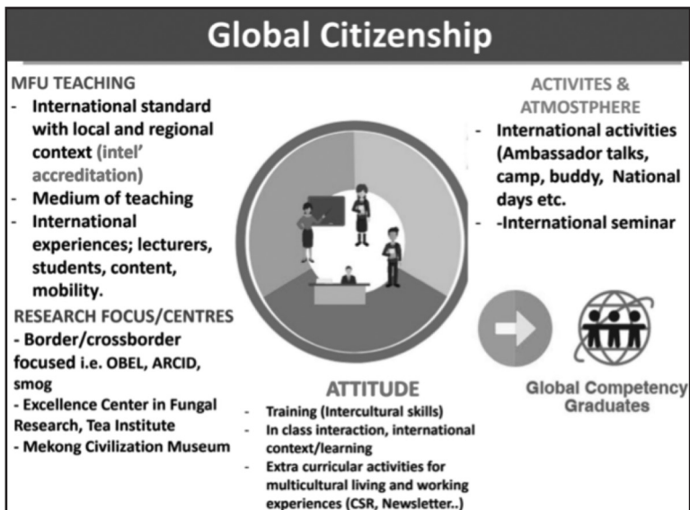
ภาพที่ 2 : ยุทธศาสตร์การสร้างความเป็นสากลของมหาวิทยาลัย

ภาพที่ 2 แสดงให้เห็นถึงยุทธศาสตร์การสร้างความเป็นสากลของมหาวิทยาลัย เพื่อให้บรรลุถึงเป้าหมายการสร้างผู้มีส่วนได้ส่วนเสียให้เป็นพลเมืองโลกนั้น มีความจำเป็นที่ต้องผลักดันให้เกิดการเรียนการสอนที่มีความเป็นสากล ในที่นี้หมายถึงการทำหลักสูตรให้มีความเป็นสากลได้มาตรฐาน โดยการผลักดันให้มีการรับรองในระดับสากล การรับคณาจารย์ต่างชาติหรือเพิ่มจำนวนนักศึกษาต่างชาติในชั้นเรียน เพื่อสร้างบรรยากาศการเรียนรู้ที่มีความเป็นสากล ตลอดจนมีการอบรมเพื่อให้คณาจารย์พัฒนาการเรียนการสอนที่ส่งเสริมโลกทัศน์ที่มีความเป็นสากล นอกจากการเรียนการสอนแล้วยังจำเป็นต้องมีการกำหนดให้งานวิจัยสร้างความรู้ที่จำเป็นสอดคล้องกับวิสัยทัศน์ของมหาวิทยาลัย ได้แก่ ความรู้ที่แก้ปัญหาข้ามพรมแดนหรือตอบโจทย์ทางสังคมด้านการพัฒนาของอนุภูมิภาค อีกสองส่วนที่สำคัญคือการสร้างทัศนคติ (Attitude) และการจัดกิจกรรมที่ส่งเสริมให้ผู้มีส่วนได้ส่วนเสียมีโลกทัศน์ที่กว้างขึ้น มีความเป็นสากล ความเป็นพลเมืองโลก ความเคารพในความแตกต่างและค่านิยมความเสมอภาค โดยเฉพาะความเสมอภาคทางเพศ