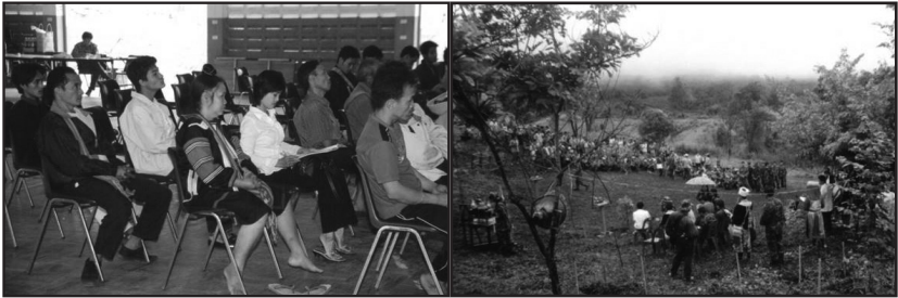
ภาพที่ 1 ตัวอย่างบทความวิชาการที่ไปนำเสนอในสถาบันวิชาการ และภาพจากการสังเกตการณ์ บทบาทสตรีชาติพันธุ์ในงานวิจัยภาคสนาม ที่อำเภอปางมะผ้า จังหวัดแม่ฮ่องสอน ช่วงปี 2547-2548