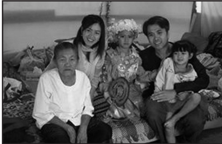
ภาพที่ 9 ครอบครัวผู้เขียนในงานบวชปอยสำอาง (บวชลูกแก้ว) ลูกชายในชุมชนที่ปางมะผ้า

ต้องการทำงานสาธารณะ ทำงานภาคสังคมแต่เราไม่เปิดเผยตัวตน ภาษาชาวบ้านเรียกว่า “ไม่รู้หัวนอนปลายเท้า” เขาจะเชื่อถือเราได้อย่างไร นี่เป็นหลักง่าย ๆ อยู่แล้วครับ ซึ่งจะต่างจากสายวิชาการที่มีกฎเกณฑ์ค่านำหน้า ตำแหน่งทางวิชาการ และเอกสารรับรองต่าง ๆ แต่ถ้าพอเราจะทำงานโดยนำแนวคิดสตรีนิยมไปใช้เป็นส่วนหนึ่งในชุมชน คุณพร้อมที่จะถูกสังคมตรวจสอบ พร้อมทั้งจะแสดงชีวิตส่วนตัวในที่สาธารณะ คือเขาจะดูเราทั้งต่อหน้า ทั้งนินทา ทั้งพูดโจ่งแจ้ง ซึ่งเป็นเรื่องปกติมาก