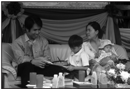
ภาพที่ 10 การเป็นวิทยากรบอกเล่าชีวิตครอบครัวของผู้เขียนในเวทีวันเด็กที่แม่ฮ่องสอน

การแบ่งชีวิตออกเป็นสี่มิตินี้ในระดับชุมชนก็ได้ปะที่เดียวนะครับ จริง ๆ มันก็จะใกล้เคียง ๆ กัน เอาเข้าจริง ๆ อย่างชีวิตส่วนตัว ห้องส่วนตัว พื้นที่ส่วนตัวของเราจะไม่ค่อยมี การดำรงชีวิตของนักสตรีนิยมในชุมชนหรือนักเคลื่อนไหวเพื่อสร้างการเปลี่ยนแปลงต่าง ๆ ในชุมชนก็ดี ไม่มีพื้นที่ส่วนตัวแบบชัดเจนหรือ Clear Cut ตรงนี้ชาวบ้านจะหาวิธีเรียนรู้สตรีนิยมรวมทั้งแนวคิดต่าง ๆ จากเราโดยอ่านชีวิตจากมิติเหล่านี้ ทั้งสี่มิตินี้เราจึงต้องเผยออกไปให้ชัดเจน ชีวิตเราแต่ละมิติของเราเป็นอย่างไรบ้าง ทั้งหลายทั้งปวง ไม่ว่าจะเป็