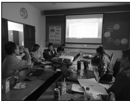
ภาพที่ 8 การประชุมวิจัยและพัฒนาสุขภาพสตรีชาติพันธุ์ที่โรงพยาบาลปางมะผ้า จังหวัดแม่ฮ่องสอน