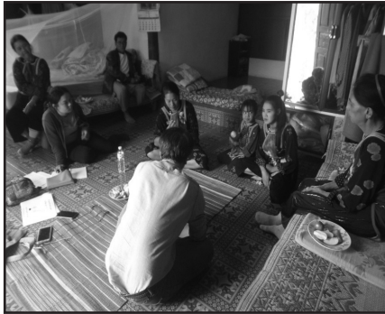
ภาพที่ 7 การสำรวจปัญหาสุขภาพสตรีชาติพันธุ์สี่ชุมชนบ้านน้ำริน อำเภอปางมะผ้า จังหวัดแม่ฮ่องสอน

การสำรวจปัญหาเรื่องของสุขภาพสตรีชาติพันธุ์ ลงพื้นที่ 4 หมู่บ้าน หมู่บ้านละ 3 เดือน ลงไปคุยทุกกลุ่ม กลุ่มแม่วัยใส กลุ่มสตรีพิการ สตรีวัยแรงงาน ผู้สูงอายุ ผู้ติดเชื้อ HIV รวบรวมเป็นฐานข้อมูล ซึ่งแต่เดิมทางโรงพยาบาลไม่มีมิติทางสังคมวัฒนธรรมเหล่านี้มากนัก เราก็ได้ทำฐานข้อมูลจุดนี้ไว้ แล้วเราก็เริ่มจัดตั้งเป็นกลไก หาดัวแทนเป็นสตรีชาติพันธุ์ในชุมชน ออภาคให้มีคนรุ่นใหม่ ที่ใช้เทคโนโลยีได้ ตรงนี้เป็นข้อมูลที่ดึงกลับมาใช้โดยมีแนวคิดสตรีนิยมและกลไกคนรุ่นใหม่ที่เป็นสตรีชาติพันธุ์ผลักดันอยู่เบื้องหลัง