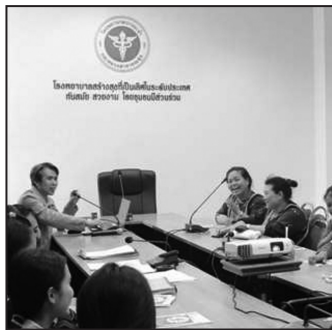
ภาพที่ 12 การประชุมพัฒนาเครือข่ายสตรีชาติพันธุ์ ที่เป็นล่ามชุมชนในโรงพยาบาลปางมะผ้า

หากมีโอกาส วันหน้าผมคงได้เล่าถึงบทเรียนการนำแนวคิดสตรีนิยมไปใช้กับโรงพยาบาลและชุมชนที่แม่ฮ่องสอน ในการพัฒนาระบบบริการสุขภาพที่เอื้อต่อการเข้าถึงสิทธิและให้บริการเป็นมิตรต่อสตรีชาติพันธุ์ มีการสร้างเครือข่ายสตรีทำหน้าที่ล่ามชุมชน และนักสื่อสารสุขภาวะขึ้นมาเป็นนวัตกรรมพื้นที่ และสร้างมุมมองสตรีให้แก่นำชุมชนเพศชายหลายคนสามารถขับเคลื่อนเรื่องนี้ร่วมกับสตรีได้อย่างต่อเนื่อง อันนี้เป็นโครงการที่ทำล่าสุดตั้งแต่ปี 2560 เรื่อยมาจนปัจจุบัน